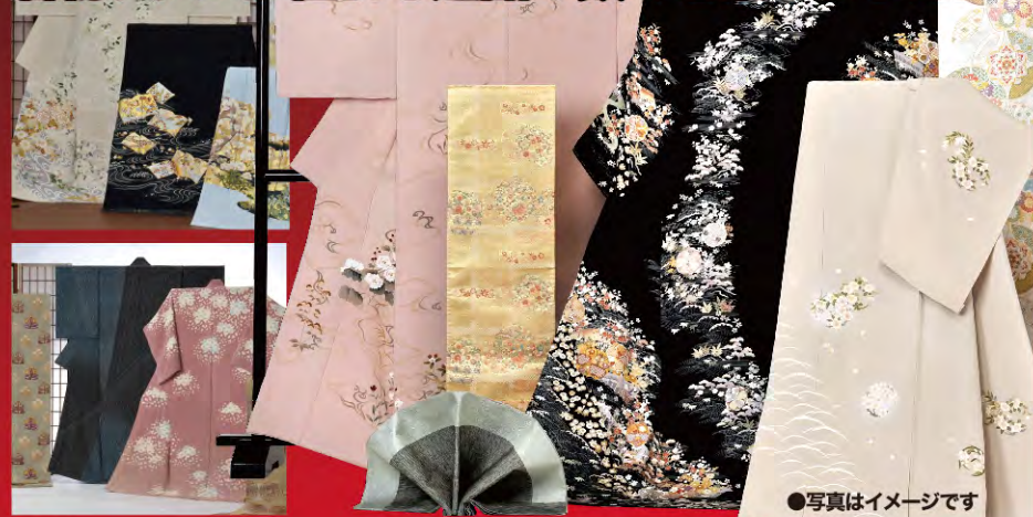
●写真はイメージです

有名作家物から全国各地の希少な紬まで 着物ファンが憧れる逸品の数々を集めました!